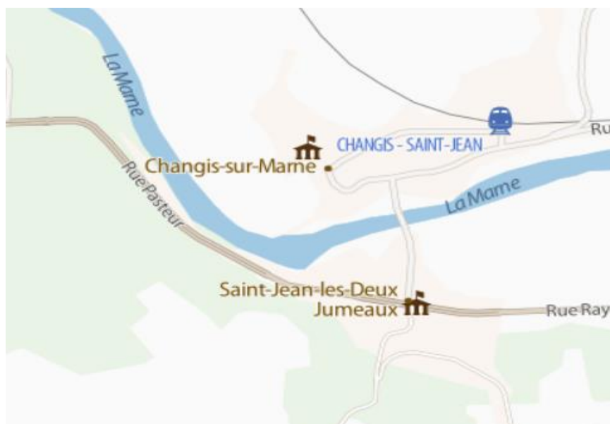
Saint-Jean les Deux Jumeaux